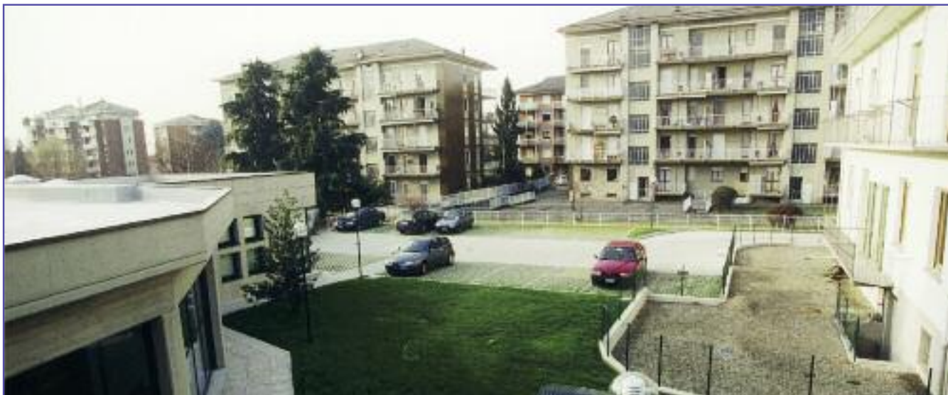
L'ingresso del parcheggio è nella via Don Sturzo a fianco del nuovo fabbricato dell'Associazione (come si osserva nella foto sopra) ovvero appena oltre la palazzina bianca.