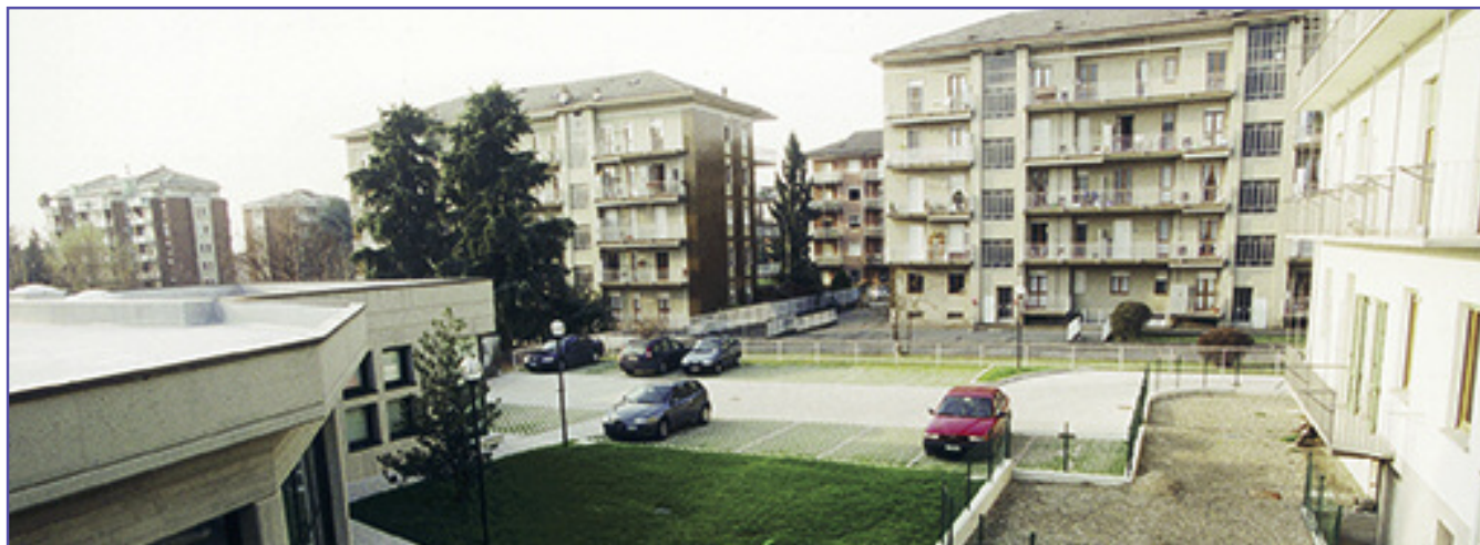
L'ingresso del parcheggio è nella via Don Sturzo a fianco del nuovo fabbricato dell'Associazione (come si osserva nella foto sopra) ovvero appena oltre la palazzina bianca.