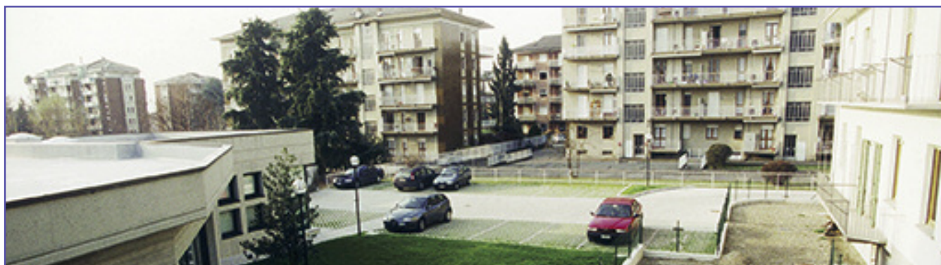
L'ingresso del parcheggio è nella via Don Sturzo a fianco del nuovo fabbricato dell'Associazione (come si osserva nella foto sopra) ovvero appena oltre la palazzina bianca.