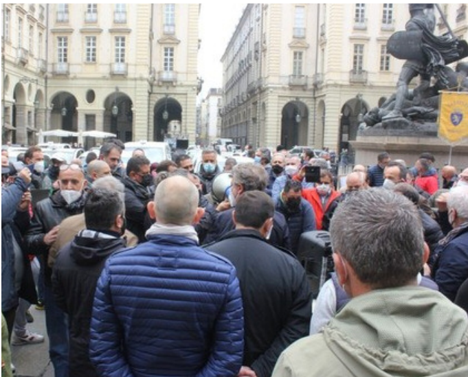
Un'immagine della manifestazione di protesta dei taxisti a Torino nella giornata di oggi, 29 aprile

In occasione della giornata di mobilitazione nazionale dei taxisti il Comitato di Coordinamento delle Confederazioni Artigiane del Piemonte ha scritto una lettera congiunta al Prefetto di Torino per evidenziare le criticità che questo importante settore della mobilità sta attra-