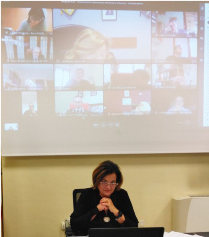
Il prefetto Franca Tancredi in videoconferenza

In esordio il Prefetto di Biella Franca Tancredi ha evidenziato come sia stimato in circa 300mila il bacino potenziale di micro-imprese che possono essere soggette alla pressione dell'usura