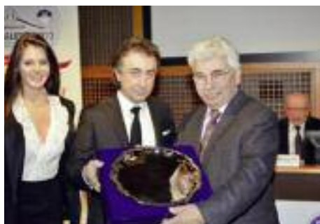
Renato Miglietti Tipografia Arte della Stampa