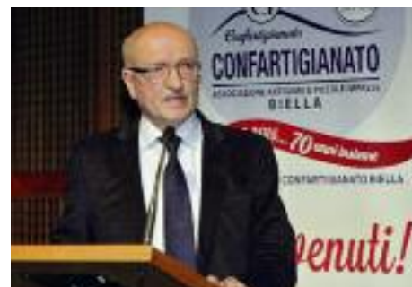
Giorgio Merletti - Presidente nazionale Confartigianato