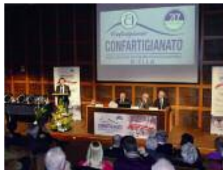
Panoramica del tavolo lavori

...seguiteci nel prossimo numero di Marzo, con le immagini delle Imprese ed Imprenditori insignite delle "Onorificenze" alla carriera ed all'"Eccellenza" artigiana