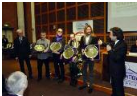
La premiazione del team "Artuniverse"