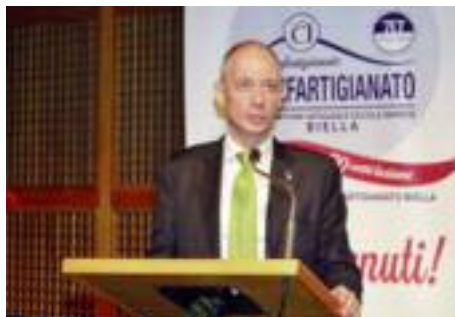
Roberto Simonetti Deputato Parlamento Italiano