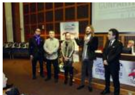
Beppe Zaia - Regista Amm.re "Artuniverse"