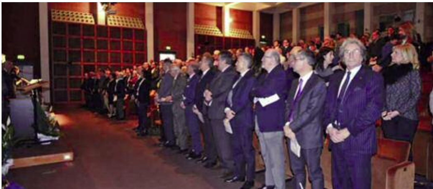
Il momento solenne dell'apertura della Celebrazione del 70° Anniversario di Confartigianato Biella... l'esecuzione dell'Inno nazionale di Mameli