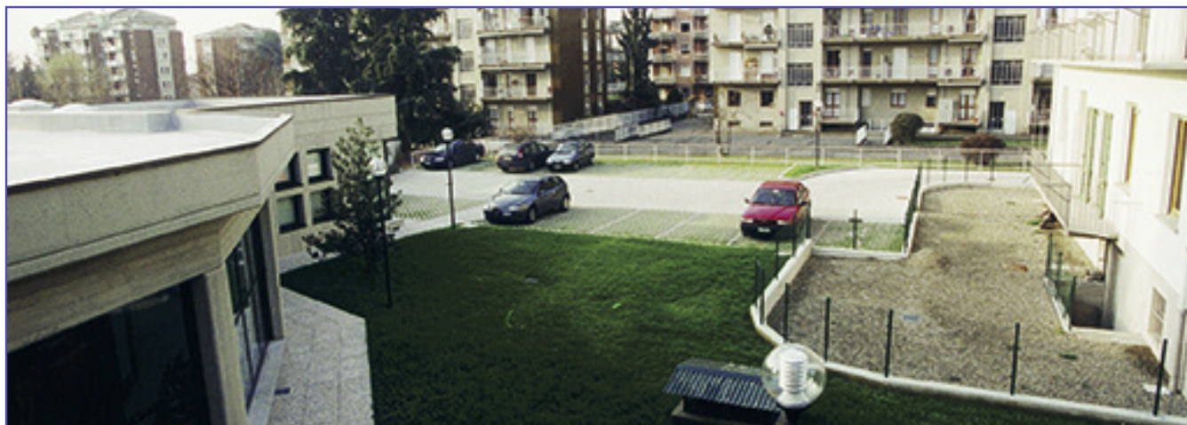
L'ingresso del parcheggio è nella via Don Sturzo a fianco del nuovo fabbricato dell'Associazione (come si osserva nella foto sopra) ovvero appena oltre la palazzina bianca.