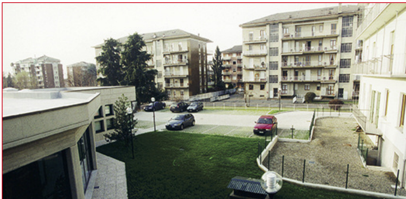
L'ingresso del parcheggio è nella via Don Sturzo a fianco del nuovo fabbricato dell'Associazione (come si osserva nella foto sopra) ovvero appena oltre la palazzina bianca.