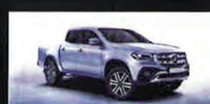
Classe X 12%

* Per usufruire delle condizioni vantaggiose previste, si dovrà fornire la tessera di Confartigianato Imprese Piemonte (o una dichiarazione sostitutiva della stessa).