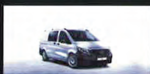
Vito: Furgone e Mixto 18% Tourer 16%