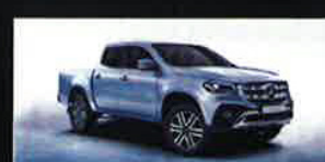
Classe X 12%

* Per usufruire delle condizioni vantaggiose previste, si dovrà fornire la tessera di Confartigianato Imprese Piemonte (o una dichiarazione sostitutiva della stessa).