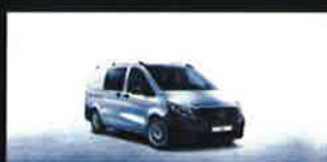
Vito: Furgone e Mixto 18% Tourer 16%