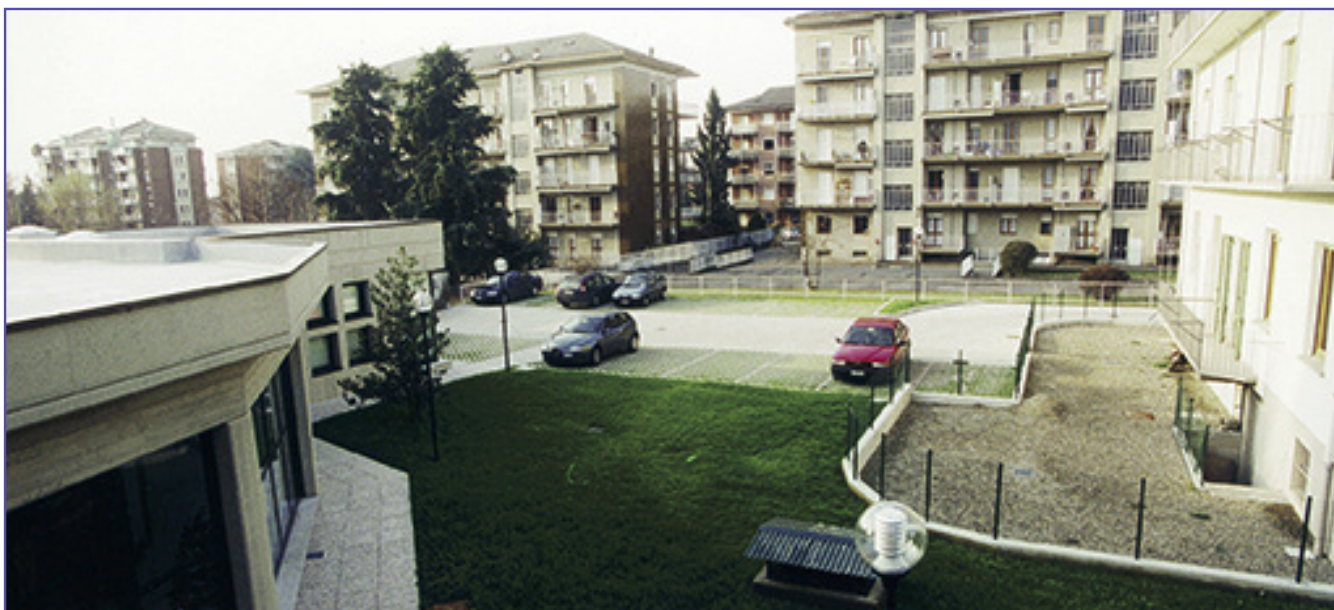
L'ingresso del parcheggio è nella via Don Sturzo a fianco del nuovo fabbricato dell'Associazione (come si osserva nella foto sopra) ovvero appena oltre la palazzina bianca.