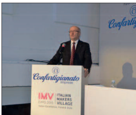
Giorgio Merletti Presidente nazionale Confartigianato

I prodotti sono stati esposti dal 9 al 15 ottobre 2015 all’EXPO 2015, nello spazio espositivo “Convivio” situato nel Cardo Nord-Ovest di Padiglione Italia.