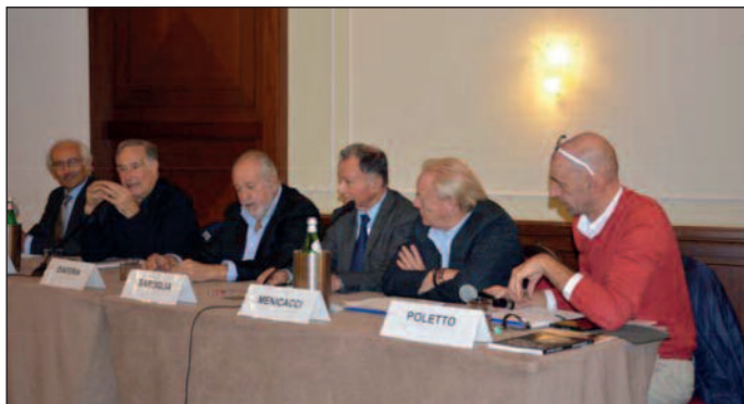
Il tavolo dei relatori

Si è svolto a Torino, nella giornata di Mercoledì 14 Ottobre presso l'Hotel Majestic, l'annuale convegno organizzato da ANAP – Confartigianato Piemonte. L'argomento è stato di estremo interesse per i partecipanti in quanto si è parlato e considerato ampiamente sui risvolti che l'attività fisica può giovare per la terza età.