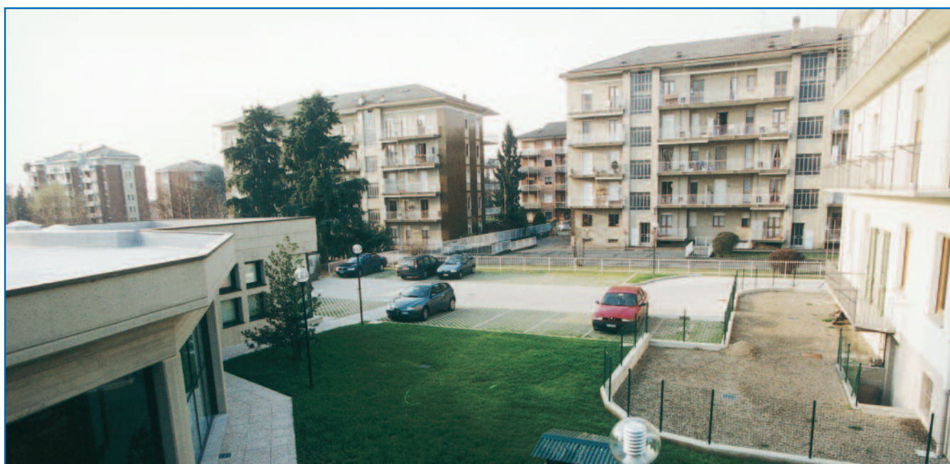
L'ingresso del parcheggio è nella via Don Sturzo a fianco del nuovo fabbricato dell'Associazione (come si osserva nella foto sopra) ovvero appena oltre la palazzina bianca.