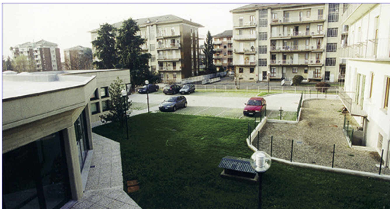
L'ingresso del parcheggio è nella via Don Sturzo a fianco del nuovo fabbricato dell'Associazione (come si osserva nella foto sopra) ovvero appena oltre la palazzina bianca.