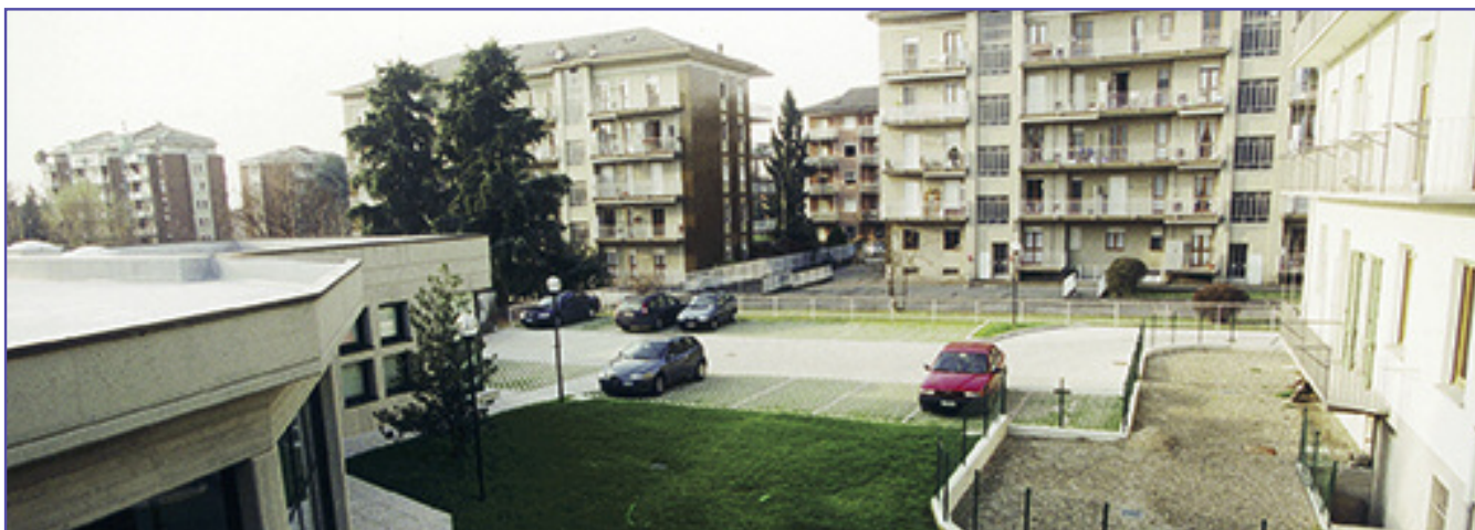
L’ingresso del parcheggio è nella via Don Sturzo a fianco del nuovo fabbricato dell’Associazione (come si osserva nella foto sopra) ovvero appena oltre la palazzina bianca.