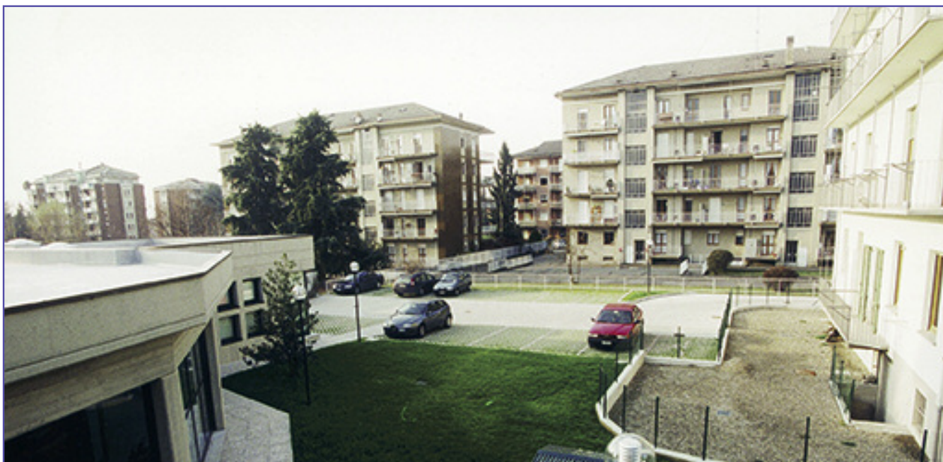
L'ingresso del parcheggio è nella via Don Sturzo a fianco del nuovo fabbricato dell'Associazione (come si osserva nella foto sopra) ovvero appena oltre la palazzina bianca.