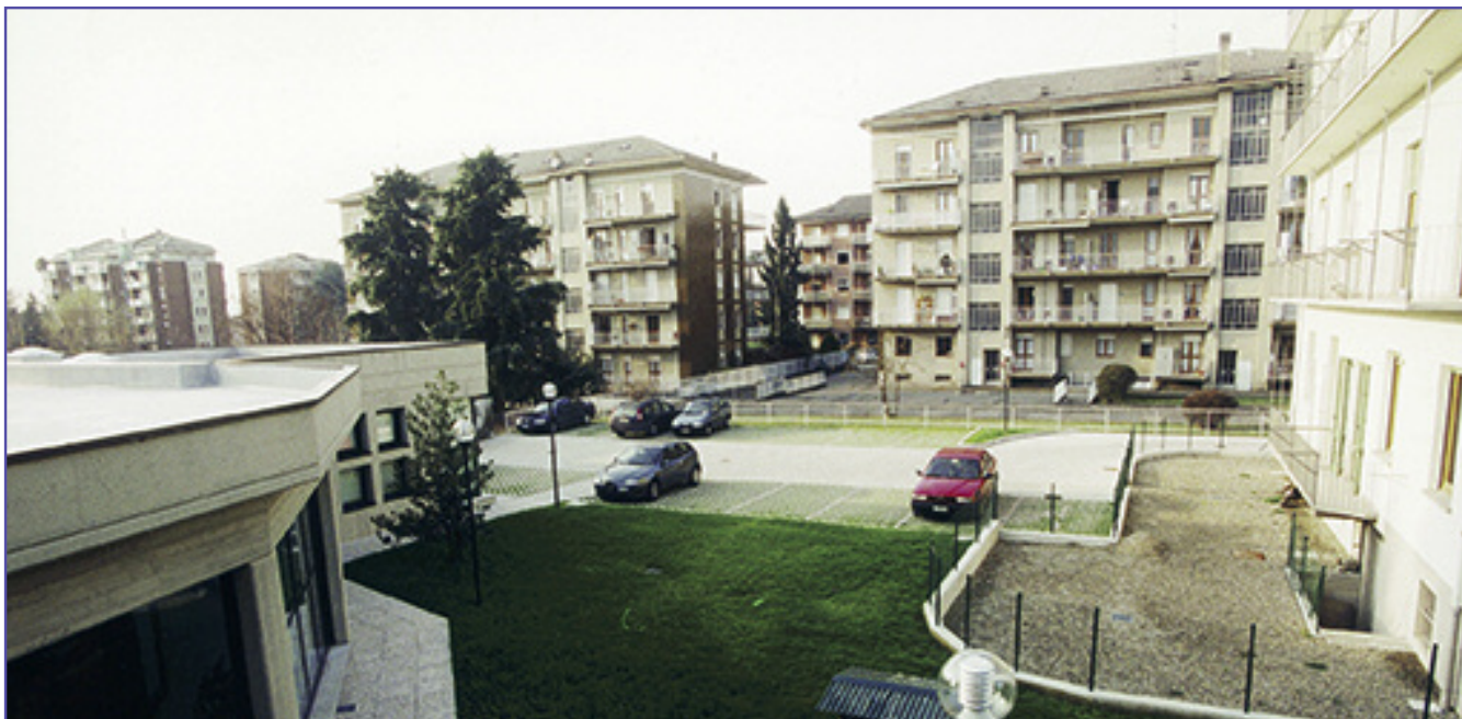
L'ingresso del parcheggio è nella via Don Sturzo a fianco del nuovo fabbricato dell'Associazione (come si osserva nella foto sopra) ovvero appena oltre la palazzina bianca.